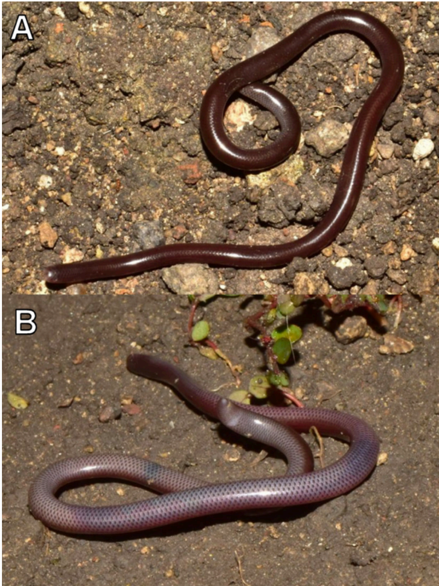
Figure 1. Indotyphlops braminus individual from the municipality of Ixtapan de la Sal, State of Mexico, Mexico. Dorsal view (A; CFH 33) and ventral view (B; CFH 34).